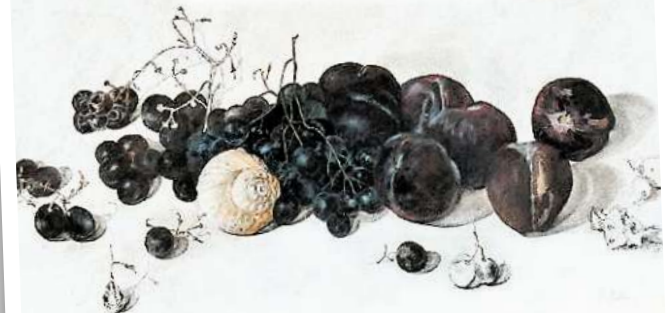
Ingeborg Hollmeyer: „Die rosa Muschel“, Farbstift auf Ölpastell. oh/4