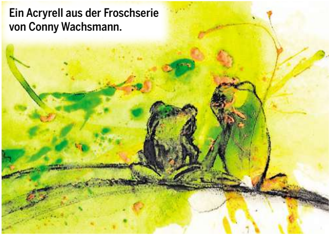
Ein Acyrell aus der Froschserie von Conny Wachsmann.